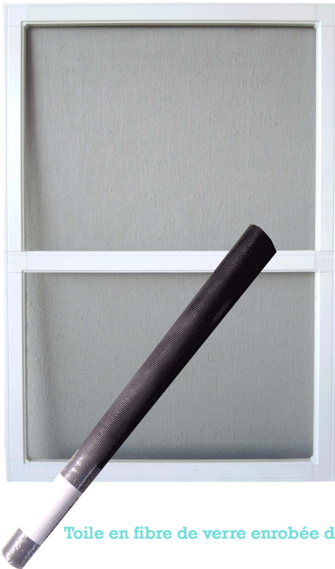
Toile en fibre de verre enrobée de PVC anti UV